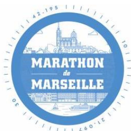
Marathon de Marseille 24 Mars 2019 + 11 000 participants