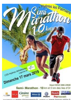
31 ème Semi Marathon de Hyères 17 Mars 2019 + 1 500 participants