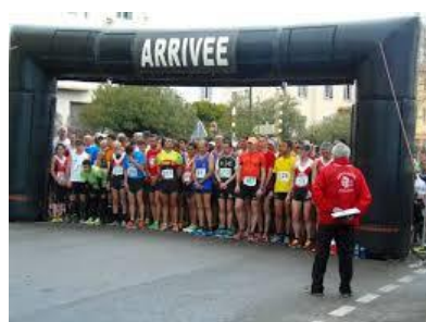
29 ème Marathon d'Ajaccio 7 Avril 2019