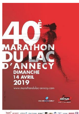
40 ème Marathon du Lac d'Annecy 14 Avril 2019 + 4 000 participants